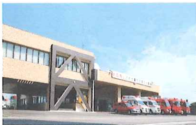
消防本部・鉾田消防署

また、管内には「鉾田海水浴場」をはじめとする多くの海水浴場と、「あやめ」で有名な水郷潮来があり、美しい自然環境に恵まれた気候温暖な地域である。