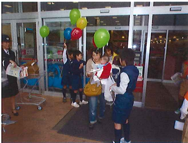
平成25年11月9～15日の全国秋季火災予防運動期間中に、横町少年消防クラブ員が銚田市横町地内で夜間広報活動を実施しました。

平成25年11月9日に銚田市のカスミ銚田店前で、旭西・横町少年消防クラブ員及び銚田市消防団女性部員住宅用火災警報器の普及と防火PR活動を実施しました。